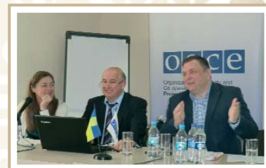
Семинар ОБСЕ з судьями ВСУ, КСУ OSCE workshop with judges of the Supreme Court of Ukraine and the Constitutional Court of Ukraine