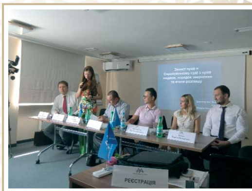
Форум «Таврійські зорі» в Херсоні Forum «Tavriiski zori» in Kherson

HEAD OF THE COUNCIL OF ADVOCATES OF KHERSON REGION