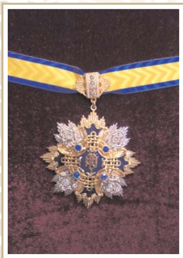
Орден «Видатний адвокат України» Order «The outstanding advocate of Ukraine»

ГОЛОВА РАДИ АДВОКАТІВ ХЕРСОНСЬКОЇ ОБЛАСТІ