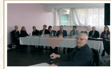
День Адвокатури Day of the Bar