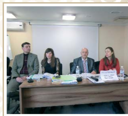
Школа адвокатської майстерності School of advocacy

Our present throws us new challenges. A challenge is a boost to development. Development is the key to growth, prospects, and new achievements. Walking this way, we are sure that the Bar of Kherson region has a future. Our future is worth fighting and worth winning!